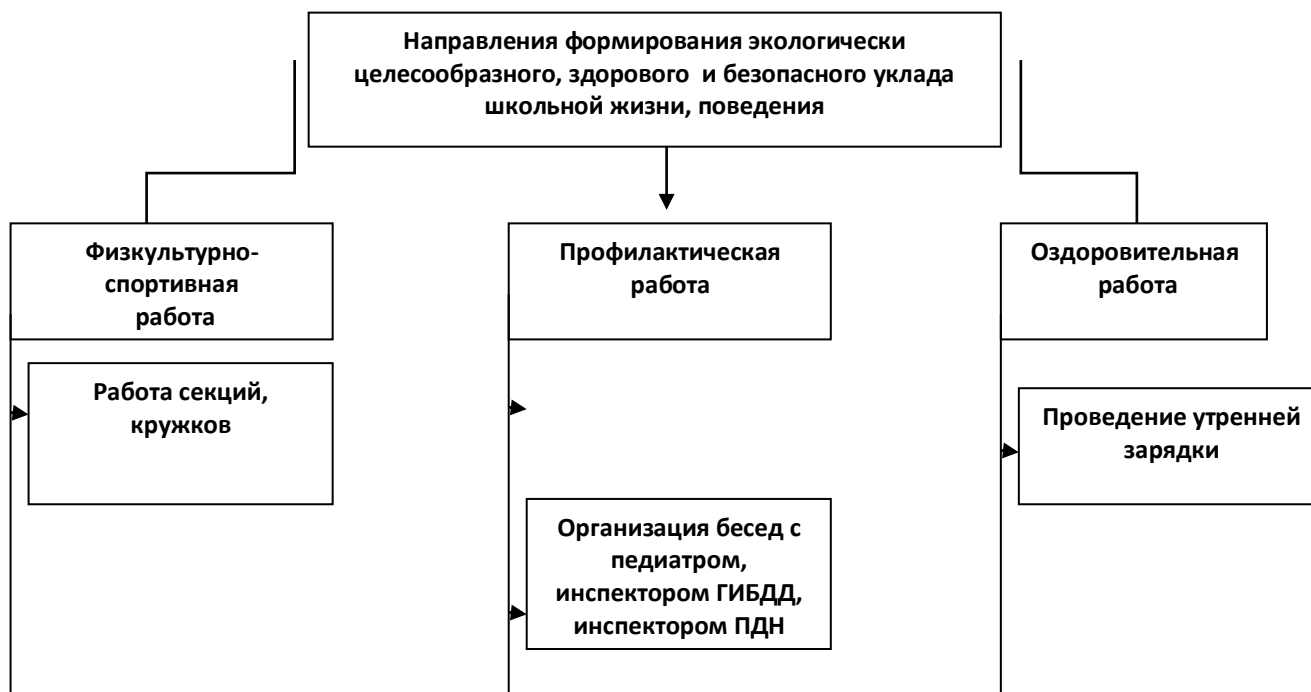
Модель организации работы по формированию экологически целесообразного, здорового и безопасного уклада школьной жизни, поведения

Раздел 3. Модели организации работы, виды деятельности и формы занятий с обучающимися по формированию экологически целесообразного, здорового и безопасного уклада школьной жизни, поведения: физкультурно-спортивной и оздоровительной работе, профилактике употребления психоактивных веществ обучающимися, профилактике детского дорожно-транспортного травматизма